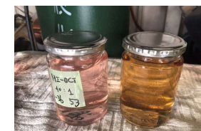
サンプルガソリン 指定外ガソリン